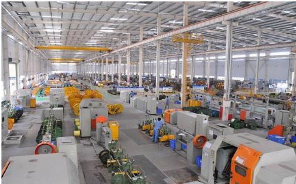
广日电气的生产现场

本会会员企业广州广日电气设备有限公司一向十分重视企业管理，通过推行科学管理，有效控制成本、提高经济